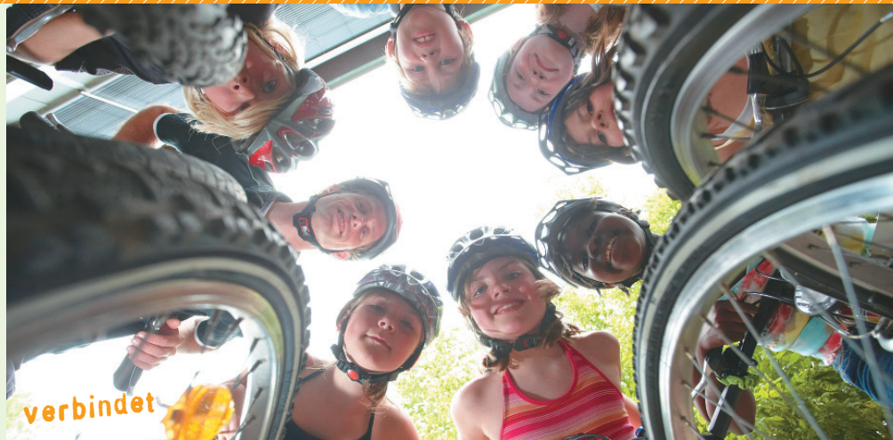
© VCD e.V. - Gestaltung und Produktion: farnehr GmbH - Fotos: Marcus Gloger - Gedruckt auf 100% Recyclingpapier